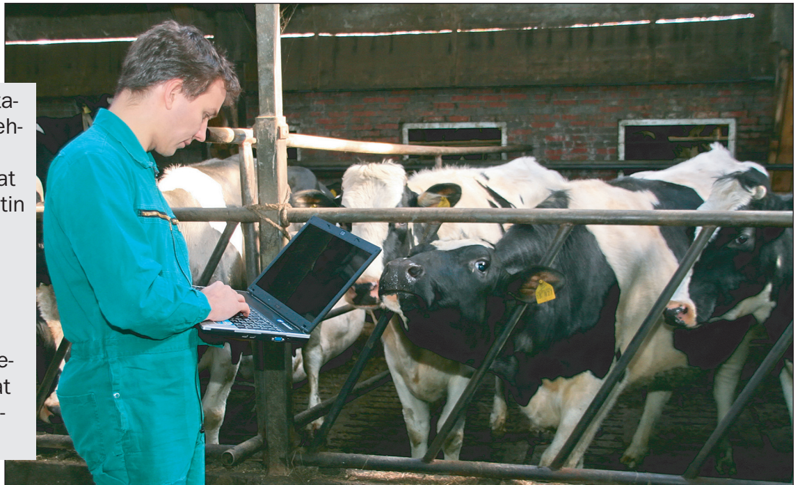
Die Digitalisierung bietet viel Potenzial, das Herdenmanagement zu unterstützen.