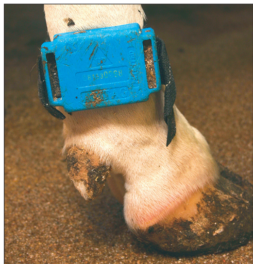
Zur Unterstützung der Brunsterkennung nutzen zehn Betriebe Sensoren, die ein tierindividuelles Verhalten aufzeigen.

Mit neuen Ideen, permanentem Interesse an Weiterbildung, der Nähe zu Medien, der jüngeren Generation und der Basis der Milcherzeugung star-